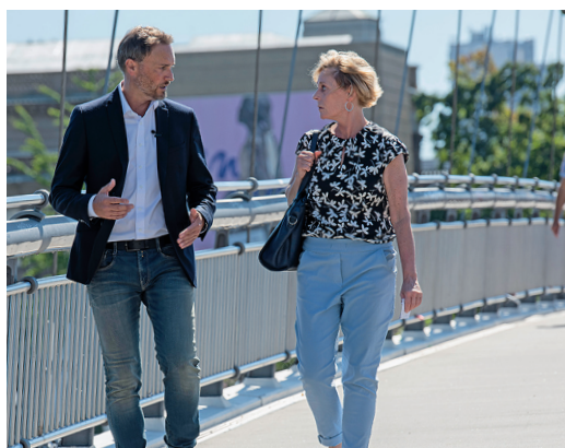
Impressionen von einer Tour durch Frankfurt an einem sonnigen heißen Donnerstag im August mit interessanten Gesprächen, spannenden Erzählungen – und mit viel Augenzwinkern.