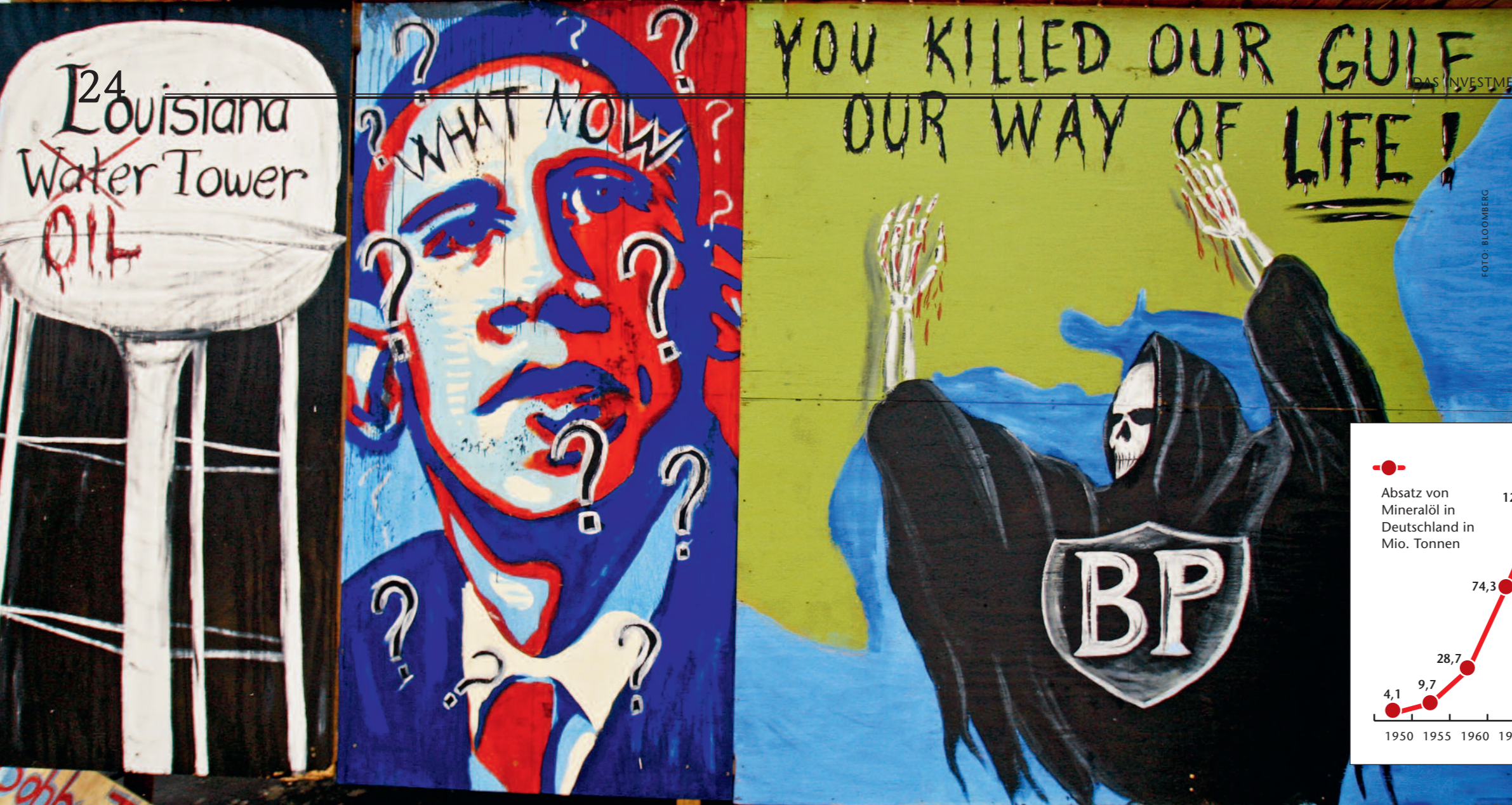
Umweltschützer haben diese Graffiti aus Protest gegen den Ölkonzern BP und Präsident Barack Obama in Larose im US-Bundesstaat Louisiana gestaltet