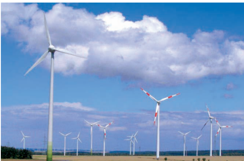
Die großen Energieversorger investieren lieber in den nächsten besten Windpark als in Energieeffizienz.