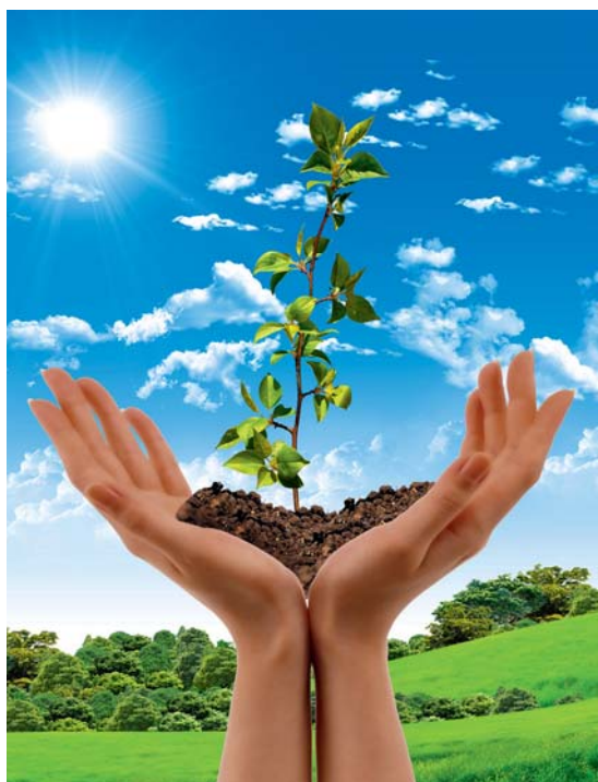
Der jüngste Fonds , der „Ökoworld Growing Markets 2.0“, wurde erst vor wenigen Wochen aufgelegt.

Aus dem ehemaligen Nischenanbieter ist mittlerweile mit einer Vielzahl an Angeboten im Bereich der nachhaltig orientierten Versi-